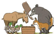
Yachi Kasano La petite boîte